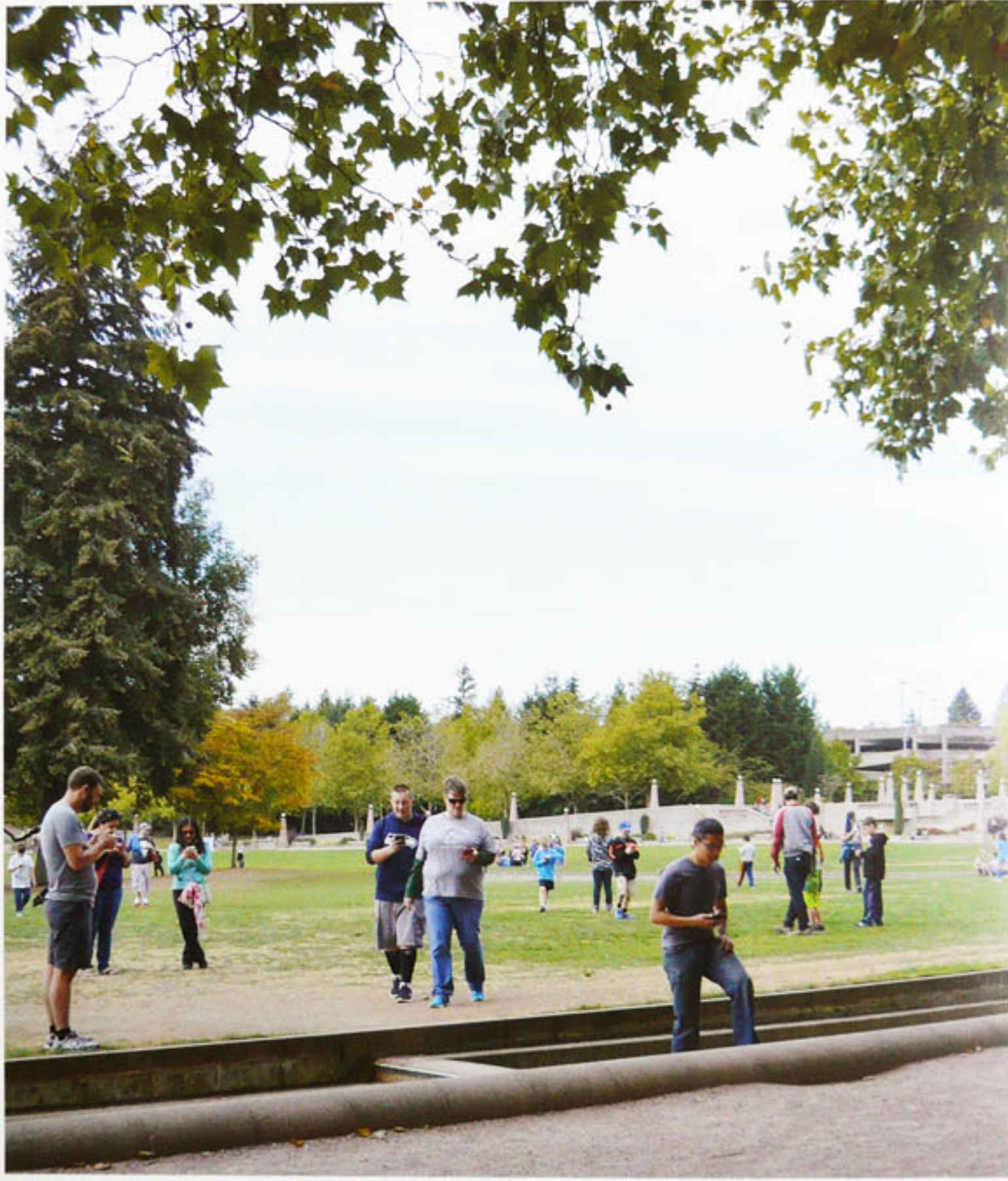
表紙 レアなポケモンが出没する人気スポット/アメリカ・シアトル ベルビューダウンタウンパーク